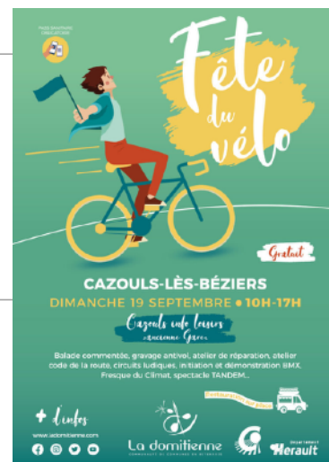
Fête du vélo à Cazouls-Lès-Béziers (La Domitienne)

Les fêtes de village sont une bonne occasion de communiquer autour du vélo. En faisant essayer des vélos électriques ou en proposant des réparations on peut sensibiliser beaucoup de monde à cette pratique. Le cadre festif est une bonne occasion de rappeler que l'utilisation du vélos peut être très agréable.