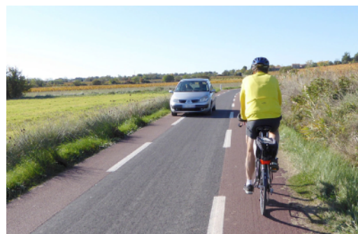
Un chaucidou (CEREMA)

Le chaucidou ou chaussée à voie centrale banalisée (CVCB) est un aménagement économique. Il est très pertinent pour la sécurité des vélos sur les routes qui voient peu de trafic et a fait ses preuves dans plusieurs pays d'Europe. Le principe : la chaussée est à double sens de circulation pour les véhicules motorisés et ils roulent au centre de la voie, lorsque deux véhicules se croisent ils peuvent utiliser la rive réservée aux modes non motorisés.