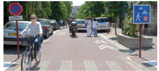
Zone de rencontre (FUB)

Il s'agit d'une rue dont un des sens est réservé aux cyclistes. Il ne s'agit pas d'un contresens, comme on l'entend encore parfois, mais d'un sens autorisé aux seuls cyclistes. Plusieurs études ont démontré que c'était un aménagement sûr, malgré le fait que cet aménagement est parfois impressionnant dans les rues étroites. Cyclistes et automobilistes doivent faire attention aux intersections.