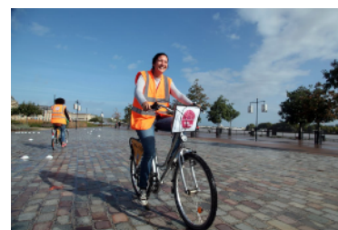
Journée de remise en selle (Vélocité)

De nombreux adultes ont eux aussi peur de reprendre le vélo qu'ils n'ont pas utilisé depuis de nombreuses années. Des associations et entreprises se sont spécialisées dans les stages de remise en selle pour adultes. En apprenant les fondamentaux de la sécurité à vélo ils sont plus en sécurité pour eux et pour les autres usagers de la route.