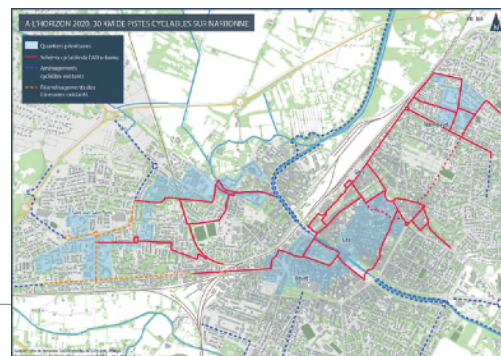
Axe cyclables identifiés de Narbonne

Une fois le diagnostic réalisé on vient hiérarchiser les voies et équipements pour penser un réseau qui permette de circuler sur la commune d'un pole générateur de déplacement à un autre ; par exemple de l'école à un quartier résidentiel. Le document de planification ainsi obtenu permet en s'y référant de réaliser un réseau cyclable complet et sur lequel les usagers peuvent venir s'appuyer pour leurs trajets quotidiens en toute sécurité. Il définit le type d'aménagements à mettre en œuvre : piste cyclable, zone 30, stationnements vélo.