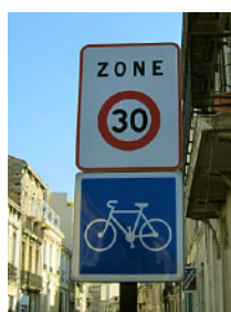
Zone 30 (Wikipedia)

Une zone 30 est un ensemble de voies constituant une zone affectée à la circulation de tous les usagers. La vitesse des véhicules y est limitée à 30 km/h. Toutes les chaussées sont à double sens pour les cyclistes, sauf exception. Des aménagements de réduction de vitesse sont à prévoir pour faire respecter les limitations de vitesses. Cela peut s'inscrire dans un projet de réaménagement urbain et paysager pour gommer l'aspect routier.