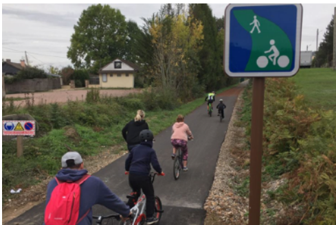
Une voie verte (France 3 région)

Une voie verte est une route exclusivement réservée à la circulation des véhicules non motorisés, des piétons et des cavaliers. Il n'est donc théoriquement pas possible de signaler comme voie verte un trottoir qui serait simultanément accessible aux piétons et aux vélos. La largeur des voies vertes doit être de 3 mètres minimum. En l'absence de règles spécifiques, la circulation y est la même que pour une autre route : circulation à droite, pas plus de deux cyclistes de front.