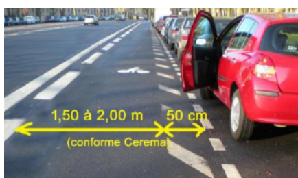
Une piste cyclable qui respecte les recommandations du CEREMA (Sécurité routière plus)