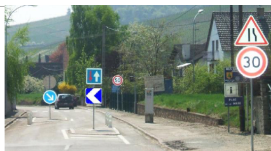
Des écluses cyclables (FUB)

Ces dispositifs, destinés à faire ralentir les véhicules en en laissant passer qu'un seul à la fois dans l'un ou l'autre sens, avec une priorité donnée à l'un des sens, sont des aménagements favorables aux cyclistes quand ils disposent des continuités cyclables de chaque côté de l'écluse. Sinon, ils peuvent être dangereux car les automobilistes tendent à s'imposer sur les cyclistes.