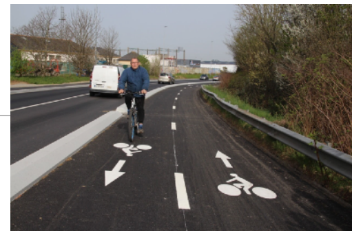
Une bande cyclable qui respecte les recommandations du CEREMA

Les piste cyclables sont la solution la plus sécurisante en trafic mixte avec des véhicules motorisés. Leur coût est important et ne pourront pas être financés dans le cadre de cet appel à projet. Néanmoins il vous est possible de demander un diagnostic pour poser un tracé et réfléchir à des solutions de financement.