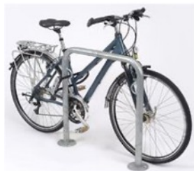
Exemple de point de stationnement vélo