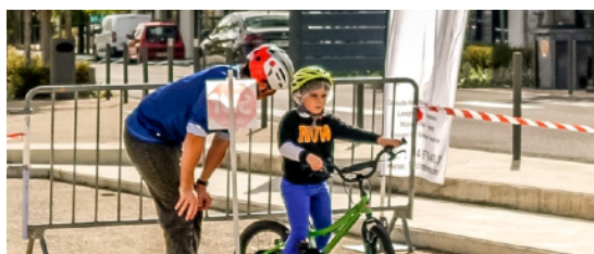
Fête du vélo à Cazouls-Lès-Béziers

Les enfants contribuent à faire changer les pratiques de leurs parents de façon insoupçonnée. Il y a quelques décennies, la pratique du vélo était beaucoup plus répandue pour se rendre à l'école.