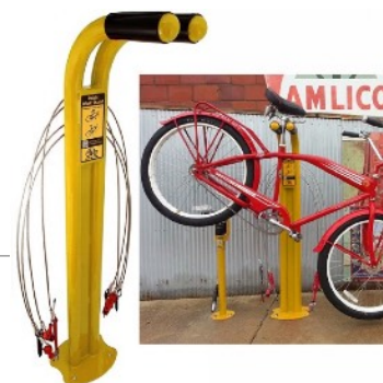
Exemple de borne de réparation en libre service

Les bornes de réparation en libre service sont un service précieux pour les usagers. Ils contiennent les outils essentiels qui permettent les réparations usuelles. Les outils sont chers et lourds, cette initiative est donc appréciée par les cycliste du quotidien comme par les cyclotouristes.